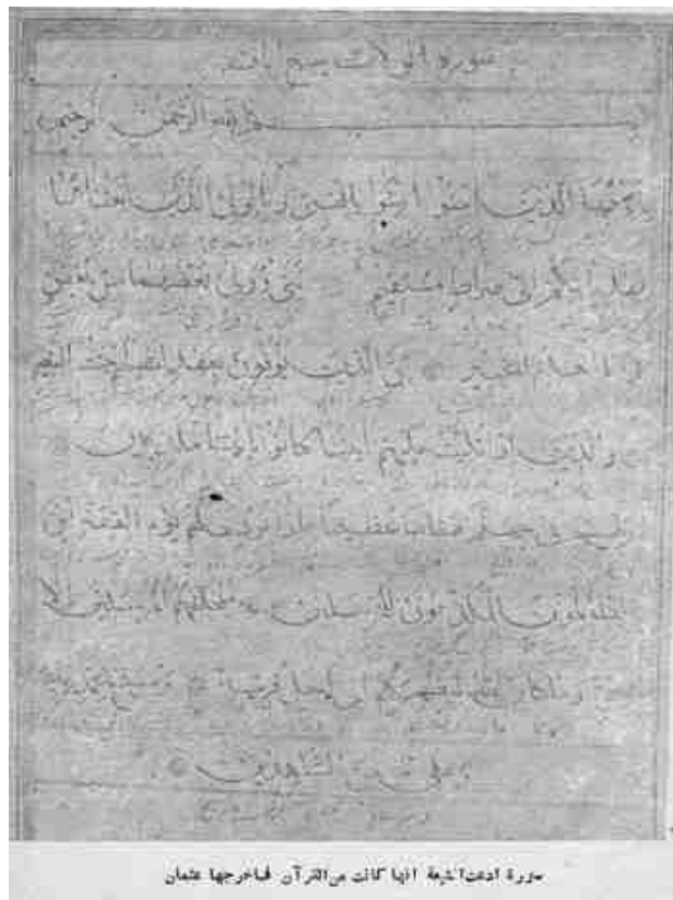
یکی از دو سوره که به قرآن افزوده اند

اما اینکه می‌گویند: روز غدیر خم عمر بیعت کرد و گفت: «بِخِ بَيْحِ لَكَ يَا عَلِيُّ أَصْبَحْتَ مَوْلَايَ وَ مَوْلَا كَلَّا مَوْمِنٌ وَ مَوْمِنَةٌ»، بیگمان اینها را ساخته اند. علی چگونه مولای عمر شده بود؟! این سخن چه معنی توانستی داشت؟! دوباره می‌گوییم: «مولا» جز بمعنی دارنده «ولاء» نبوده. اینکه مولا را بمعنی «آقا» نیز می‌آورند از زمانهای دیرتر آغاز شده.