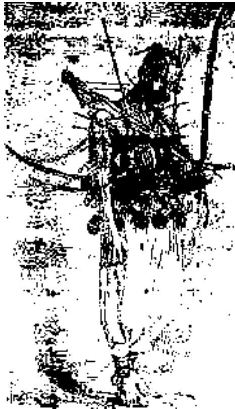
یکتن قفل به تن

پارسال یک گدای سید چولاغی در خیابانهای تهران بود که پیاپی نام «امام زاده داود» را بزبان می آورد: «امامزاده داود حاجت روا گرداند»، «امامزاده داود ترا ذلیل نکند»، «امامزاده داود قرضت ادا کند». از صبح تا شام اینها ورد زبانش بود.