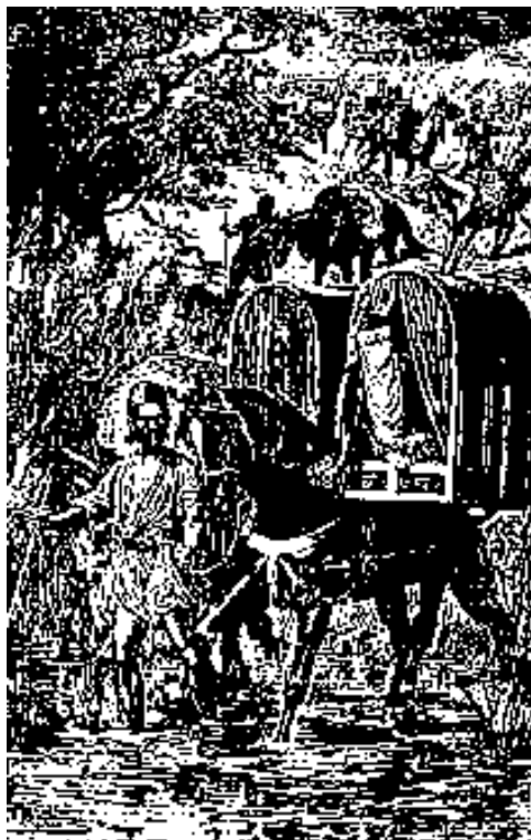
زن ایرانی به زیارت کربلا میروود

چنین گمانی نتوان برد و این بدبختی از خود مردمست. خود این مردم آلوده و گرفتارند و دچار این بدبختی گردیده اند. خواهید گفت: آلودگیشان چیست؟. میگویم: آلودگیشان نادانی و ناهمبختیست که من نمونه هایی از آن برای شما یاد کردم.